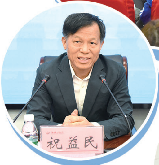
▲省卫健委党组副书记、副主任祝益民讲话。