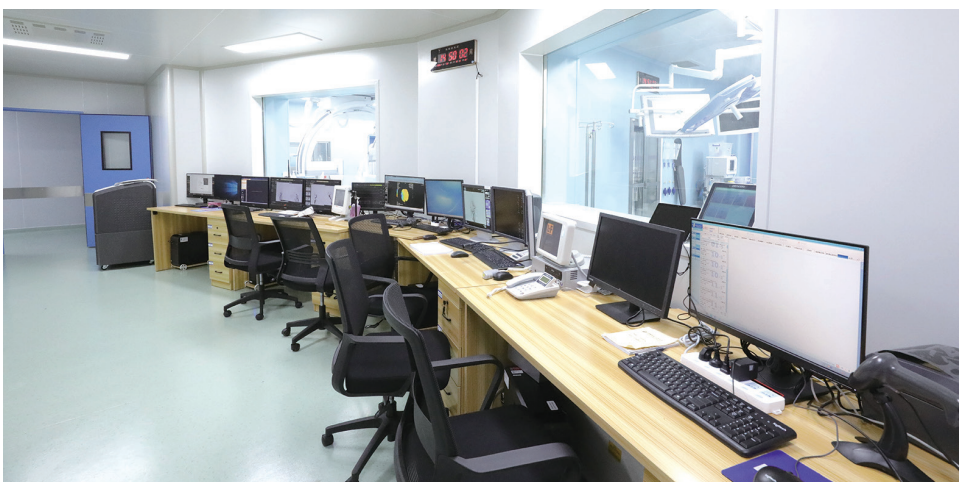
▲ 设有直播屏的复合手术室。