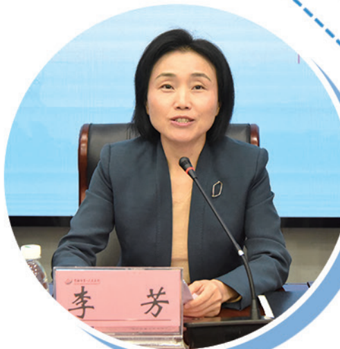
▲市卫健委党组书记、主任李芳讲话。